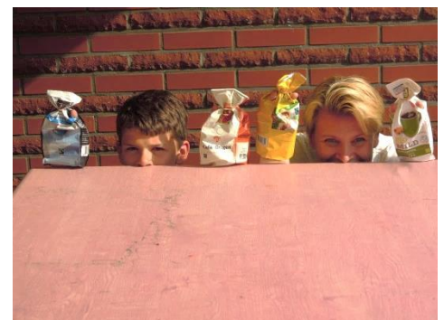
Lars met handpoppes van FT koffieverpakkingen